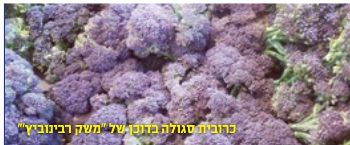
כרובית סגולה בדוכן של "משק רבינוביץ"

מתי ואיפה א' מתכונת מצומצמת ב'-ה' 09:00-20:00 יום ו' 07:00-17:00 שבת 09:00-20:00 האנגר 12, נמל תל אביב